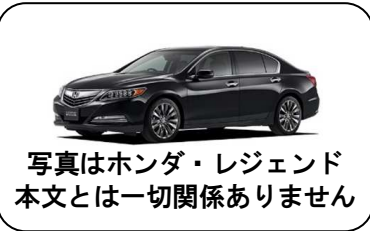
写真はホンダ・レジェンド 本文とは一切関係ありません

ただ最近、普通に日本語でいいのに無理に外来語を使っている場合もありますよね。例えば、伝説と言えはいいのに「レジェンド」とか、無秩序でまとまりのないことを「カオス」だとか・・・おじさんはもうついていけません！おそらく若い人の中でも、さほど意味もわからず何となく使っている人も多いのではないのでしょうか？あと許せないのは、新年の挨拶に「あけおめ」と言ってる人ね(笑)。