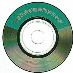
東海医療学園専門学校校歌CD

劉学院長は3年生に対し、スライド等を使用して直接学院の概要等の説明を行い、その後、今後の両校のより深い交流について語り合った。