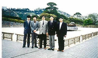
遼寧中医学院より来訪

本校の施設や授業を見学された後、観光、お食事を交えながら、今後の友好関係の継続、夏季研修旅行の充実、両校間の教員の交流等が協議された。