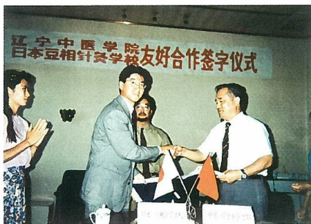
遼寧中医学院との交流締結