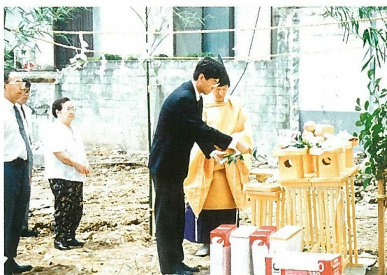
新校舎建設の地鎮祭

昭和32年の開校以来、約30年間使用してきた校舎であったが、学校養成施設認定基準の改正に伴い、同じ桃山町へ移転新築の計画を進め7月から建築工事が着工された。